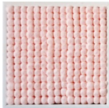
ACOUSTIC PAINTING #1, 2012