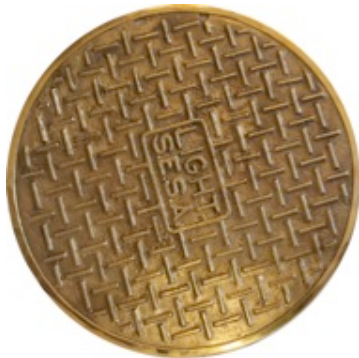
LIGHT S.E.S.A., 2013